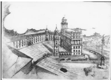
Projekt Zamku Królewskiego

Budowa Pałacu Kultury i Nauki wywarła również negatywny wpływ na odbudowę substancji historycznej. Socrealistyczna estetyka Pałacu wpływała na formy planowanej odbudowy budynków historycznych, przy której ówczesne władze odrzucały co do zasady „strupieszale”, jak wyraził się Bolesław Bierut, podejście konserwatorów zabytków na rzecz swobodnego przekształcania przestrzeni, których przykładami były wizje odbudowy Zamku Królewskiego czy Zamku Ujazdowskiego w Warszawie (z przeznaczeniem na Teatr Wojska Polskiego).