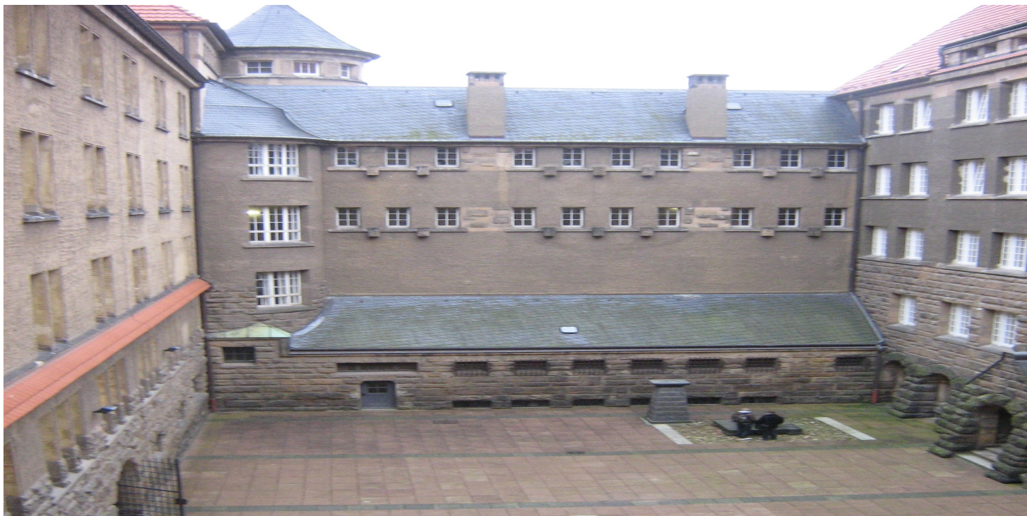
Plac na którym wykonywano egzekucje

https://przystanekhistoria.pl/pa2/teksty/106758,Egzekucja-zolnierzy-Narodowych-Sil-Zbrojnych-w-Dreznie.html