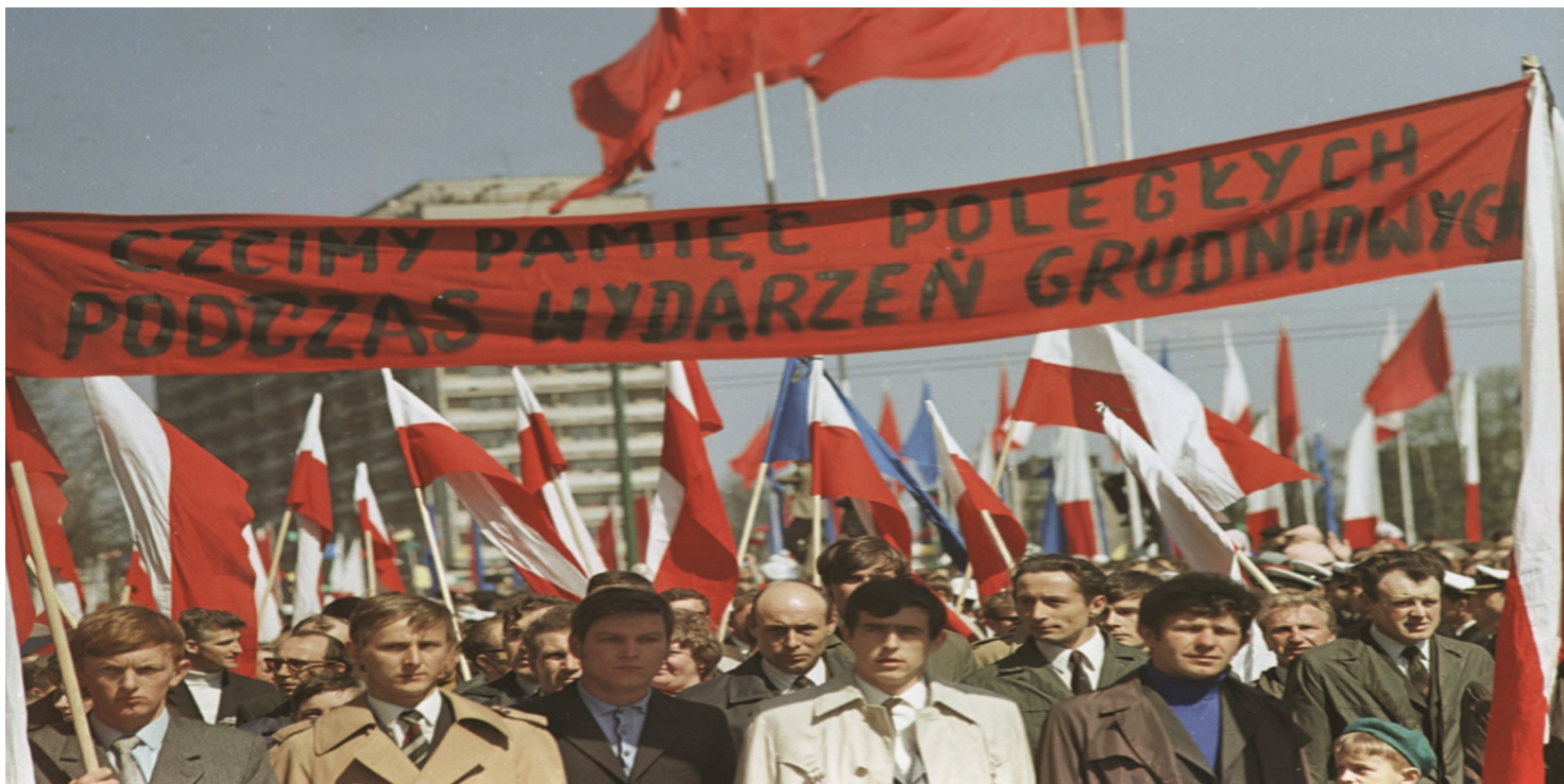
Żałobny protest 1 maja 1971 r. w Szczecinie.

https://przystanekhistoria.pl/pa2/teksty/91466,Zalobna-manifestacja-1-maja-1971-roku-w-Szczecinie.html