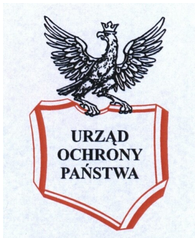
Logo Urzędu Ochrony Państwa