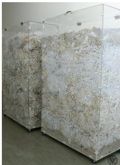
Gabloty ze zniszczonymi aktami służb terroru i represji PRL

uznano za konieczne ich internowanie (w ramach akcji o kryptonimie „Jodła”) z chwilą wprowadzenia stanu wojennego. W odróżnieniu od akt lustrowanego TW „Jędrka”, teczki pozostałych dwóch TW o pseudonimach „Anhelli” i „Sufler” zachowały się. W teczkach obu tych TW zachowały się zarówno pobierane w ramach akcji „Klon” lojalki, jak i pisemne zobowiązania do ich współpracy z SB. Dokumentacja z tych akt, jak i weryfikujące ją przesłuchania obrazowały zupełnie inne losy tych dwóch osób: TW „Sufler” współpracował z SB do roku 1990 i był bardzo cenionym źródłem – co potwierdził jego drugi oficer prowadzący oraz sam TW przesłuchany jako świadek. Natomiast TW „Anhelli” podczas pierwszego spotkania po werbunku, w lutym 1982 roku stanowczo odmówił współpracy i oświadczył funkcjonariuszowi, że zobowiązanie podpisał pod presją i ze strachu, ale obecnie odmawia wszelkich kontaktów i jest gotów ponieść tego konsekwencje. Sprawy te miały jeden wspólny mianownik: dokumentacja TW była prowadzona przez funkcjonariusza bardzo rzetelnie i odzwierciedlała jego rzeczywiste kontakty z tymi osobami, a odmawiający współpracy TW „Anhelli” został niezwłocznie wykreślony z rejestru TW – co wytrącało argumenty o rzekomo fikcyjnej rejestracji „dla poprawienia statystyki” co do lustrowanego TW „Jędrka”.