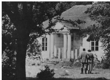
Dwór na Wileńszczyźnie, widok około lat 20. XX w.

W pierwszych miesiącach 1919 r. Polska nie miała wystarczających sił, by walczyć jednocześnie na wielu frontach. 10 stycznia 1919 r., będąc jeszcze pod wrażeniem zajęcia Wilna przez bolszewików, gen. Stanisław Szeptycki, Szef Sztabu Generalnego Wojsk Polskich, w piśmie do Józefa Piłsudskiego, Tymczasowego Naczelnika Państwa i zwierzchnika polskiej armii, zwrócił uwagę, że jednym z głównych celów stojących przed WP było „wstrzymanie fali bolszewickiej”, które to zadanie wobec wzrostu nastrojów rewolucyjnych w Niemczech i nadciągania, po zajęciu Wilna, wojsk sowieckich, urasta do rangi najpilniejszego. Rady te nie zostały wysłuchane – na próbę odzyskania Wilna Piłsudski zdecydował się dopiero w kwietniu 1919 r., gdy nadciągała już z zachodu „błękitna armia” gen. Józefa Hallera i zakończyły się walki o Lwów. Dokonała się również w tym momencie ewakuacja większości wojsk niemieckich, więc polscy żołnierze mieli otwartą drogę na wschód.