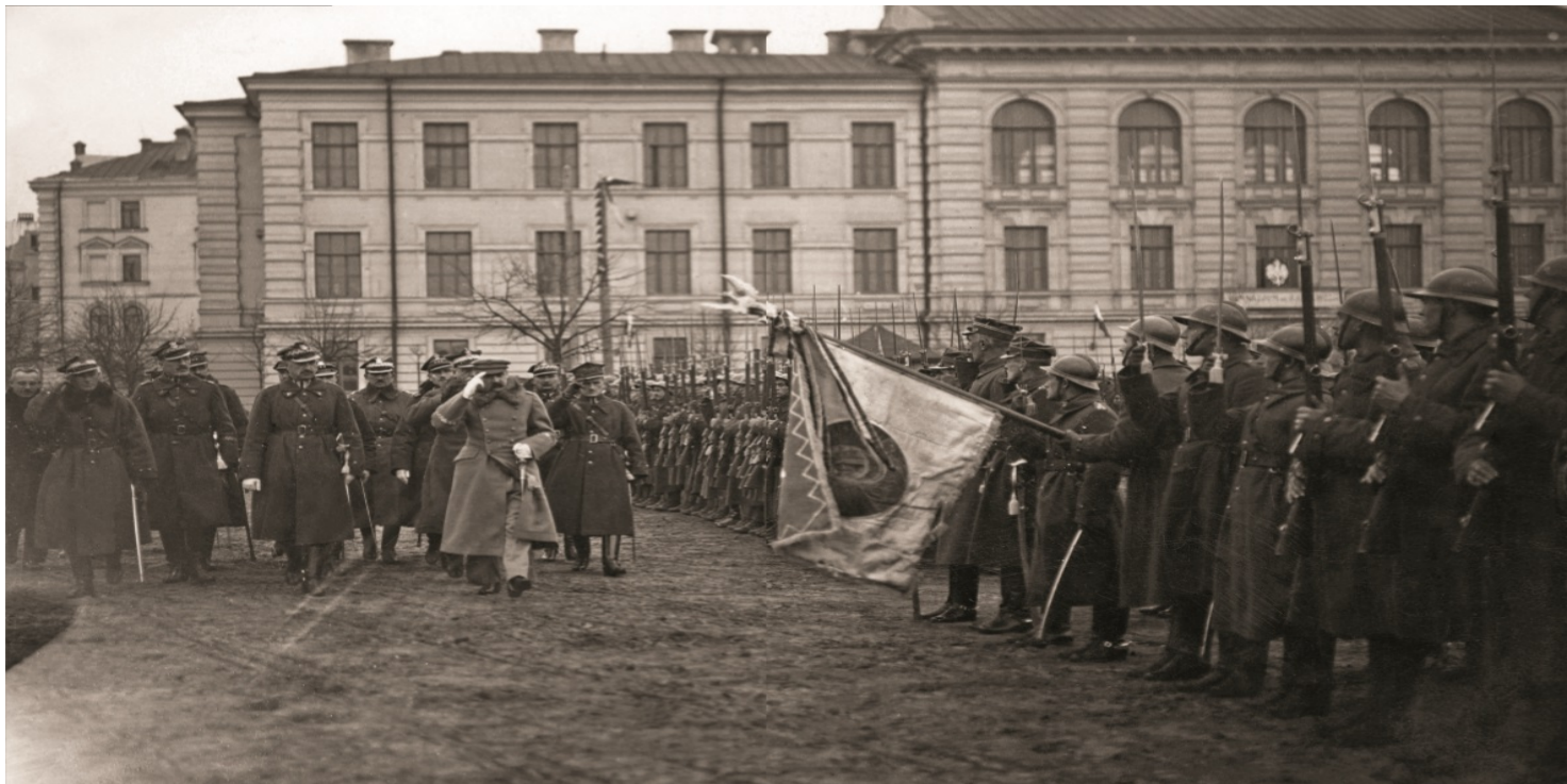
Przegląd wojska dokonany przez Naczelnika Państwa Józefa Piłsudskiego po zajęciu Wilna, kwiecień 1919 r.

https://przystanekhistoria.pl/pa2/tematy/bialorus/89504,Starania-Polakow-z-Wilenszczyzny-o-wlaczanie-ich-ziem-do-Polski-w-1919-roku.html