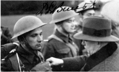
Edvard Beneš przyznaje nagrody Josefowi Gabczykowi i Janowi Kubisowi, 1940.

We wspomnianych już Aneksach przedstawione zostało wyposażenie grupy „Andropoid”. Mamy tutaj także wykaz czechosłowackich stopni wojskowych, z podaniem ich polskich odpowiedników.