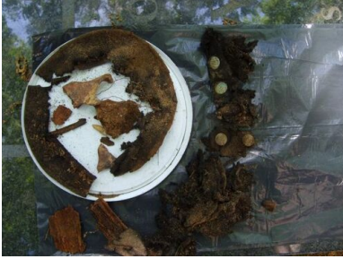
Szczątki munduru wydobyte podczas ekshumacji na Cmentarzu Osobowickim we Wrocławiu, 2008 r.

naczelnika więzienia, lekarza i duchownego. Określono również co należy zrobić w przypadku, gdy po oddaniu salwy lekarz stwierdziłby, że skazaniec wciąż żyje. W takiej sytuacji przepisy przewidywały, że dowódca plutonu jest obowiązany do oddania strzału z broni krótkiej w skroń skazańca 27 . Obecnie wiemy, że omawiane przepisy były lekceważone i osoby, odpowiedzialne za przeprowadzane egzekucje na więźniach w polskich więzieniach w latach stalinizmu, nie respektowały ich.