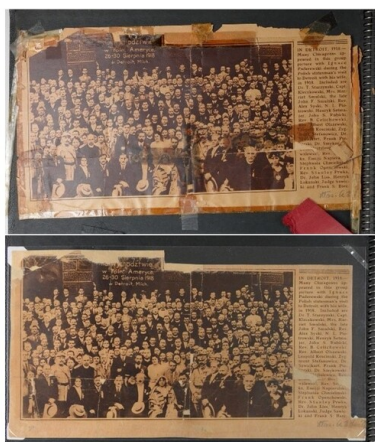
Fragment pierwszej karty Albumu z poklejonym taśmami wycinkiem

Podjęte działania pozwoliły maksymalnie zahamować procesy starzeniowe i zminimalizować przyczyny powstawania zniszczeń mechanicznych jak i chemicznych. Naprawa dawnych uszkodzeń i wprowadzenie nowego sposobu montażu umożliwiły bezpieczne korzystanie z obiektu. Dzięki niewielkim zmianom w ułożeniu zdjęć, każdy element jest widoczny, nie ma przypadków zachodzenia na siebie zdjęć. Poprawiły się także znacząco walory estetyczne albumu.