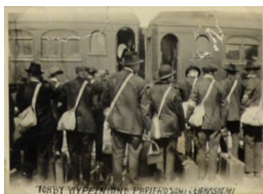
Ochotnicy przed podróżą do