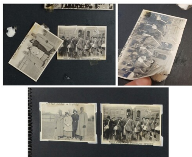
Zdjęcia z wyjazdu do Niagara-on-the-Lake. U góry - stan przed konserwacją, jedno zdjęcie luźne, drugie z przedarciami i śladami kilkukrotnego wrywania, przymocowane klejem i taśmą klejącą. Na dole - stan po konserwacji, naprawione zdjęcia