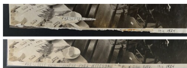
Fragment zdjęcia przed konserwacją i po niej (fot. 18, 19)

Do wykonania niezbędnych napraw konieczny był demontaż wszystkich zdjęć i wycinków znajdujących się w albumie. Każdy element oczyszczono z zabrudzeń i pozostałości papierów ze starych albumów. Tym samym odsłonięto część adnotacji z odwroci zdjęć. Usunięto także taśmy klejące. Wszystkie ubytki uzupełniono wklejając papierowe uzupełnienia. Przedarcia i miejsca osłabione wzmocniono podklejając je bibułą japońską. Naprawione karty wzmocniono, odkwaszono i wyprostowano.