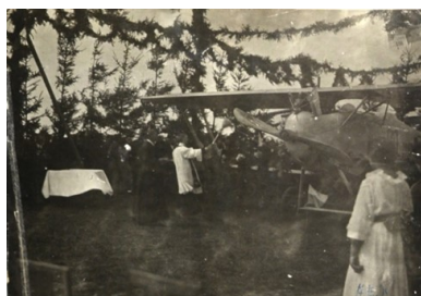
Poświęcenie pierwszego polskiego samolotu, 23 sierpnia 1919 (fot. 9)

czasach kryzysu niewiele było chętnych do pomocy weteranom. KP SWAP organizował zbiórki pieniędzy, odwiedzał weteranów w szpitalach, dbał o groby poległych i organizował schroniska dla bezdomnych. Pomagano także hallerczykom, którzy zostali w Polsce.