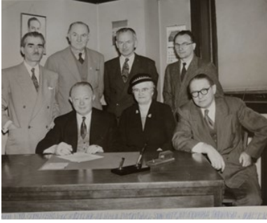
Komitet redakcyjny książki „Czyn zbrojny wychodźstwa polskiego w Ameryce: zbiór dokumentów i materiałów historycznych” (fot. 14)