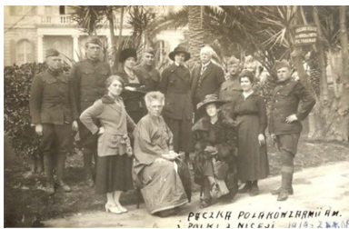
Zdjęcie z czasu rekonwalescencji żołnierzy w Nicei (fot. 7)