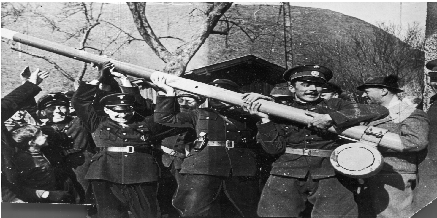
Austriacy i niemieccy celnicy demontują słupy i zapory celne pod Salzburgiem, 15 marca 1938 (NAC)

https://przystanekhistoria.pl/pa2/tematy/gestapo/34366,Pamietac-i-zyc.html