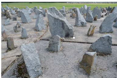
Kamień upamiętniający radomskich Żydów na terenie niemieckiego obozu zagłady w Treblince