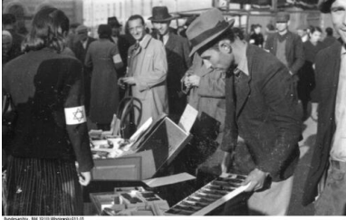
Handel w radomskim getcie

robotnikom przymusowym, zatrudnionym w radomskiej fabryce broni, oraz ich rodzinom. Identyczną obietnicę złożono również funkcjonariuszom Żydowskiej Służby Porządkowej, pozwalając im wszystkim przenieść się wraz z bliskimi do jednego z domów przy ul. Pereca. W ten właśnie sposób Niemcy zapewnili sobie nie tylko lojalność żydowskich policjantów, ale wręcz ich współpracę podczas akcji wysiedleńczej.