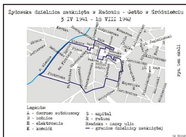
Schemat getta w Śródmieściu w Radomiu

Większość radomskich Żydów, obejmująca ok. 25 tys. osób, mieszkała w tzw. dużym getcie, położonym w śródmieściu. Warunki życia były tutaj nieco lepsze niż na Glinicach, przede wszystkim ze względu na możliwość prowadzenia czarnorynkowego handlu i zdobywania żywności.