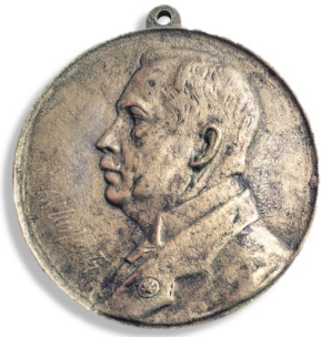
Medalion z wizerunkiem Wojciecha Korfanteo odlany w związku z niedoszłą nominacją na premiera, 1922 r. Ze zbiorów Muzeum Miejskiego w Siemianowicach Śląskich

gabinet Witosa podał się do dymisji. W tej sytuacji Korfantomu pozostała tylko działalność parlamentarna.