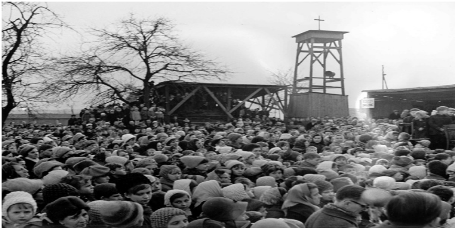
Msza w tymczasowej kaplicy

https://przystanekhistoria.pl/pa2/tematy/karol-wojtylajan-pawel/100923,Arka-Pana-Pierwszy-kosciol-w-Nowej-Hucie.html