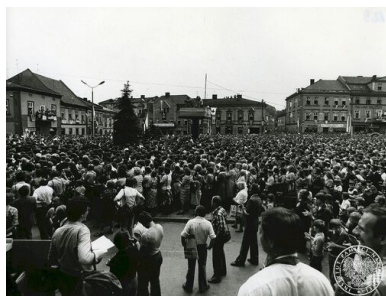
Jan Paweł II w Wadowicach

Esbecy starali się systematycznie rozpoznawać nastroje społeczne i wykrywać tendencje niekorzystne dla komunistycznej władzy. Przede wszystkim jednak usiłowali przeciwdziałać wszystkiemu, co mogłoby wprowadzić akcenty polityczne w czasie uroczystości z udziałem papieża albo pobudzić wiernych do