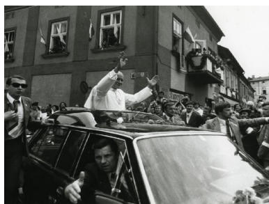
Jan Paweł II w Wadowicach

Ochronę pielgrzymki zapewniała głównie Milicja Obywatelska, za bezpieczeństwo papieża odpowiadało Biuro Ochrony Rządu, zaś Służba Bezpieczeństwa miała chronić partię komunistyczną przed niepożądanymi skutkami politycznymi papieskiej wizyty. Działania te podjęło dwa tysiące funkcjonariuszy SB z całej Polski, w niektórych przedsięwzięciach wspieranych przez milicjantów.