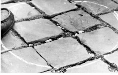
Watykan, Rzym, Plac św. Piotra - zabezpieczone po zamachu na Ojca Świętego Jana Pawła II łuski.