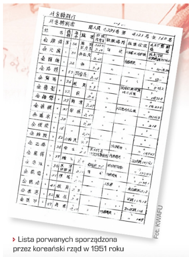
► Lista porwanych sporządzona przez koreański rząd w 1951 roku