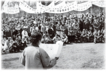
► Odczytanie petycji KWAFU do prezydenta Syngmana Rhee, 1954 rok

Korei. Jako pierwszy na jego czele stanął późniejszy prezydent Syngman Rhee – lepiej znany w Polsce jako Li Syn Man , „czarny charakter” późniejszej propagandy komunistycznej..