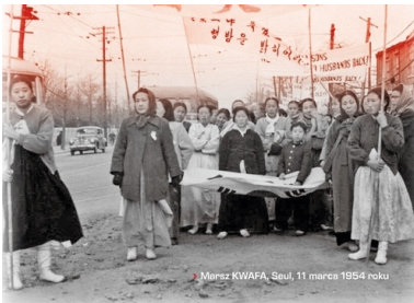
► Marsz KWAFU, Seul, 11 marca 1954 roku