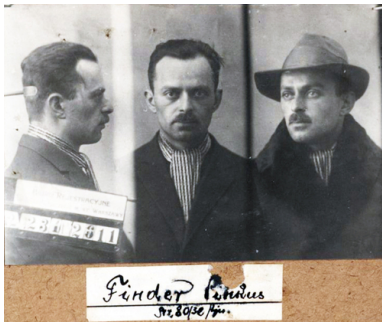
Paweł (Pinkus) Finder po aresztowaniu przez Policję Państwową za działalność komunistyczną 1934 r.