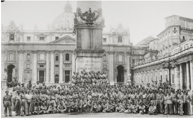
Żołnierze 2. Korpusu Polskiego przed bazyliką św. Piotra w Rzymie, 12 sierpnia 1944 r.

W 1943 r. na Wydziale Historii Kościoła Uniwersytetu Gregoriańskiego uzyskał stopień doktora. W tym okresie wspomagał działalność charytatywną kard. Augusta Hlonda wśród Polaków, którzy znaleźli się na wygnaniu. Wysłał także transporty z żywnością dla dzieci do Warszawy i Krakowa.