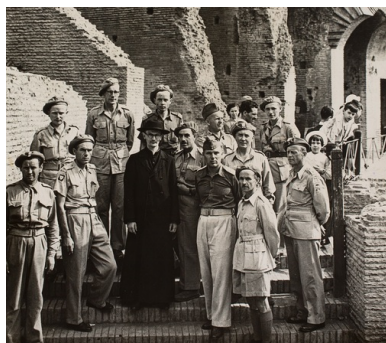
Żołnierze 5. Kresowej Dywizji Piechoty w rzymskim Koloseum, 12 sierpnia 1944 r. Fot. z zasobu AIPN (zbiór Edwarda Czwaczki - stoi 2. na prawo do księdza, na tym samym poziomie schodów)

Domy formacyjne zgromadzenia zapewniały całościową edukację współbraciom przygotowujących się zarówno do święceń kapłańskich, jak i braciom zakonnym, którzy w zgromadzeniu salezjańskim nazywani są koadiutorami. W sierpniu 1939 r. we wszystkich tych placówkach przebywało łącznie 701 salezjanów, w tym 245 księży, 189 koadiutorów, 267 kleryków i 54 nowicjuszy. Zgodnie z charyzmatem zgromadzenia wysiłek salezjanów koncentrował się na wychowywaniu młodzieży na „dobrych chrześcijan i prawych obywateli”.