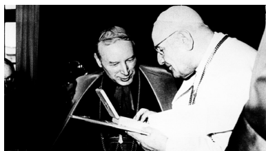
Prymas Stefan Wyszyński z Janem XXIII.

Polscy hierarchowie przybywający w pierwszych latach po wojnie do Watykanu, np. abp Adam S. Sapieha, odbierający kapelusz kardynalski w 1946 r., zapewne nieraz słyszeli tę opinię. Można powiedzieć, że słowa Piusa XII trafiały w sedno odpowiedzi na pytanie o stosunek Kościoła katolickiego w Polsce do władzy komunistycznej. Ta konstatacja, czyli zdanie: nie chcemy konfliktu, ale jesteśmy nań przygotowani, towarzyszyła kolejnym prymasom – Augustowi Hlondowi, Stefanowi Wyszyńskiemu i Józefowi Glempowi – przez cały okres istnienia komunizmu w Polsce. Inaczej mówiąc, Episkopat Polski zakładał, że sam nie będzie prowokował ataków angażujących go bezpośrednio w spór polityczny z władzą narzuconą Polakom, ale będzie bronił prawa katolików polskich do wyznawania wiary.