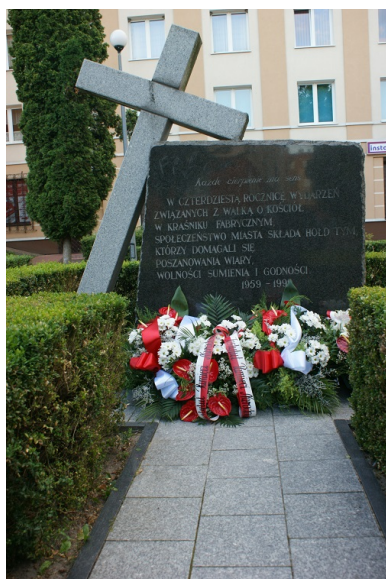
Pomnik usytuowany przy dawnym budynku Prezydium Powiatowej Rady Narodowej w Kraśniku Fabrycznym, gdzie ZOMO brutalnie stłumiło protest domagających się swobody praktyk religijnych.

Jeszcze tej samej nocy zatrzymani trafili do milicyjnego aresztu. Większość z nich po przesłuchaniu została zwolniona po kilkunastu godzinach lub w ciągu paru dni. Wobec pozostałych zastosowano areszt tymczasowy. Po przesłuchaniach, ludzie ci trafiali do aresztów w kilku okolicznych zakładach karnych.