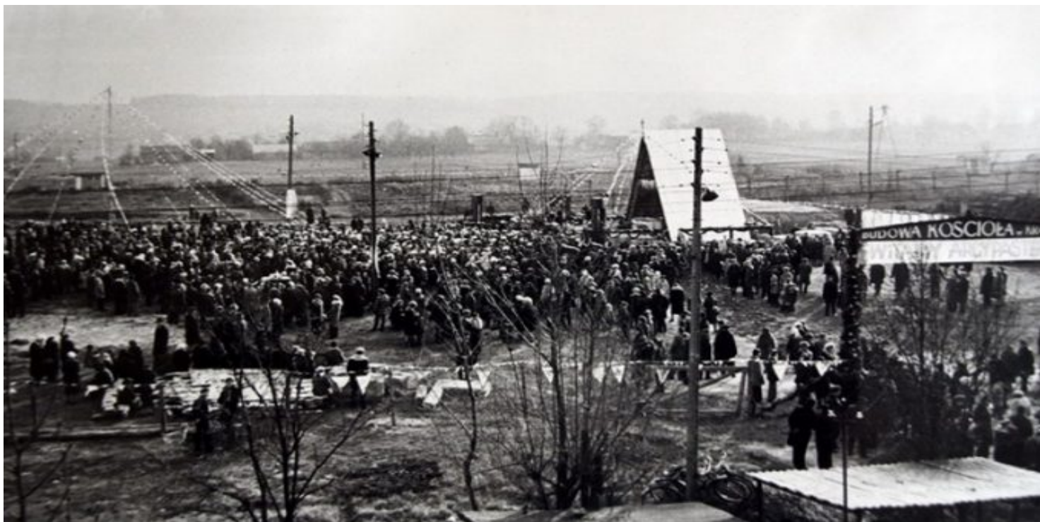
Poświęcenie placu pod budowę pierwszego kościoła w Kraśniku Fabrycznym, 1978 r.

https://przystanekhistoria.pl/pa2/tematy/kosciol/64686,To-mialo-byc-kolejne-miasto-bez-Boga.html