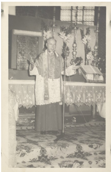
Kardynał Stefan Wyszyński podczas ponownego poświęcenia katedry św. Jakuba i św. Agnieszki w Nysie, 15 sierpnia 1959 r.