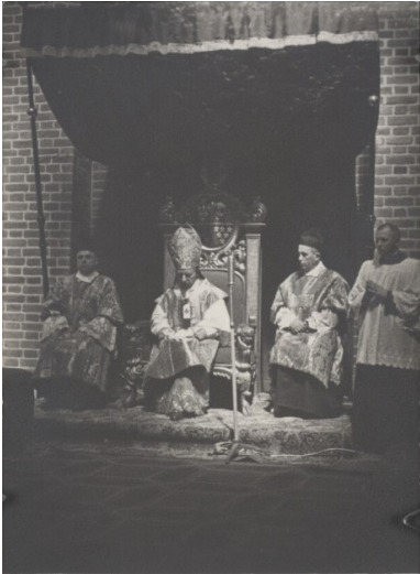
Prymas Stefan Wyszyński podczas uroczystości poświęcenia odbudowanej po II wojnie katedry św. Jana Chrzciciela we Wrocławiu, 29 lipca 1951 r.

Pierwszy taki duszpasterski objazd odbył już w październiku 1949 r. W listopadzie 1951 r. podróż po Ziemiach Zachodnich rozpoczął od miejscowości Cybinki k. Słubic w administraturze gorzowskiej, następnie udał się do Wrocławia, a na koniec do administratury opolskiej. Zanotował: