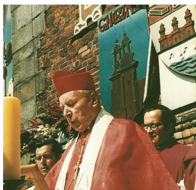
Prymas Stefan Wyszyński przemawia podczas jubileuszu 975-lecia biskupstwa w Kołobrzegu, 1975 r.

To stwierdzenie zostało przetłumaczone na język niemiecki i obiegło ówczesne media.