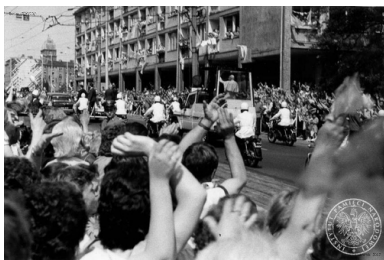
Jan Paweł II przejeżdża ulicami Szczecina pozdrawiany przez wiernych, 11 czerwca 1987 r.