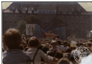
Wierni zgromadzeni na mszy papieskiej na Jasnych Błoniach w Szczecinie, 11 czerwca 1987 r.

„Polskiego Państwa Podziemnego”, co nastąpiło tuż przed wyjazdem na pielgrzymkę do Piekar Śląskich. W związku z tym zarzutami oczekiwano, że kuria podejmie stosowne działania i wpłynie na księży z parafii pw. św. Stanisława Kostki współpracujących z opozycją.