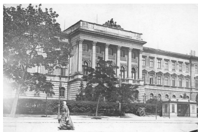
Gmach główny Politechniki

Chociaż to politechnika była kolebką „Promienistych”, organizacja szybko rozszerzyła działalność na całą Galicję. Nabrawszy charakteru ogólnozaborowego, zaczęła być kierowana także przez ludzi niezwiązanych z politechniką, m.in. przez Mariana Kukiela i Stanisława Kota. 6