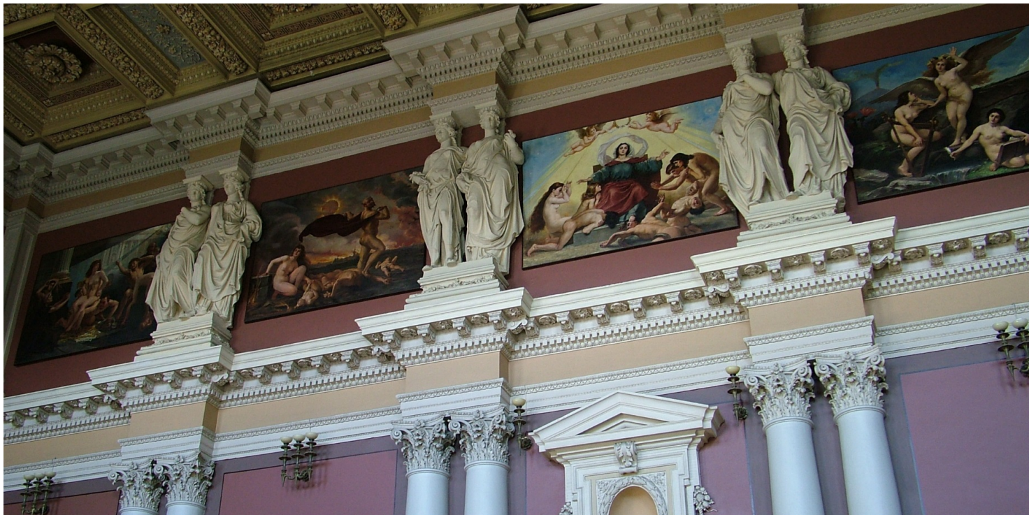
Aula gmachu głównego Politechniki Lwowskiej z obrazami Jana Matejki.

https://przystanekhistoria.pl/pa2/tematy/kresy/62943,Politechnika-Lwowska-Kuznia-kadr-II-Rzeczypospolitej.html