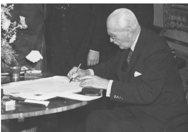
Podpisanie przez prezydenta RP Ignacego Mościckiego aktu erekcyjnego pod budowę nowych gmachów Wydziału Mechanicznego i Elektrotechnicznego Politechniki Lwowskiej, 1938 r. Przed objęciem urzędu Głowy Państwa