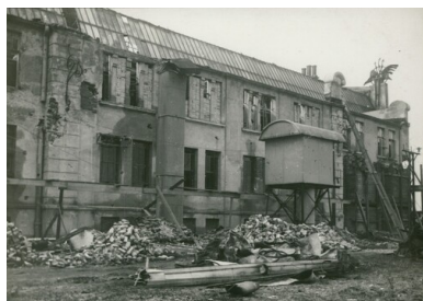
Polska, Lwów, elektrownia miejska na Persenkówce zniszczona przez Ukraińców podczas ich zbrojnej próby zaboru tego polskiego miasta jesienią 1918 r.