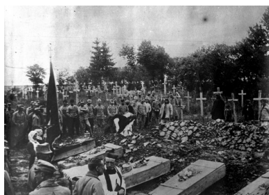
Pogrzeb polskich obrońców Lwowa poległych w obronie tego miasta przed Ukraińcami, listopad 1918 r.