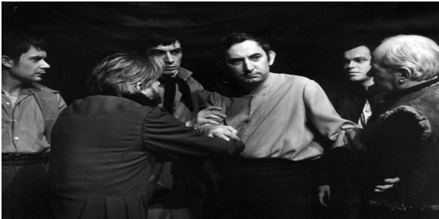
Premiera 25 XI 1967 r. w Teatrze Narodowym. W środku, od przodu, Gustaw Holoubek w roli Konrada

https://przystanekhistoria.pl/pa2/tematy/kultura/104340,Najwazniejszy-spektakl-teatralny-w-polskiej-historii-Dziady-w-inscenizacji-Kazim.html