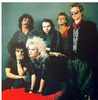
Artyści zespołu Lombard

Warto przy tym temacie unikać uproszczeń, banalizacji, czy interpretacji w tonie zbyt komediowym, jednak ze znanych relacji i dostępnej literatury wynika, że kontakty z cenzurą były dla twórców rockowych kłopotem, z którym na ogół radzili sobie sprawnie i, poza wyjątkami, cenzura nie przyczyniła się do drastycznego ograniczenia ich działalności. Doznawali nieraz uczucia upokorzenia i wściekłości, poza tym kontaktowali się z rzeczywistością absurdalną, ale przede wszystkim zdroworozsądkowo szukali najlepszego rozwiązania (tzw. furtki). Niektórzy z wykonawców czy ich menadżerów przychodzili nawet do urzędu z własną maszyną do pisania, pogodzeni zawczasu z koniecznościami wyższymi i sprawę załatwiali od ręki.