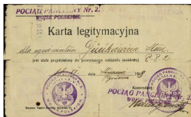
Karta legitymacyjna ogniomistrza pociągu pancernego nr 2 „Śmiały” z 1918 r.