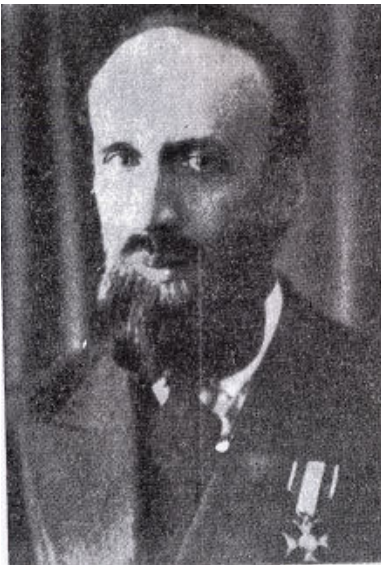
Tadeusz Szturm de Sztrem w 1933 r.