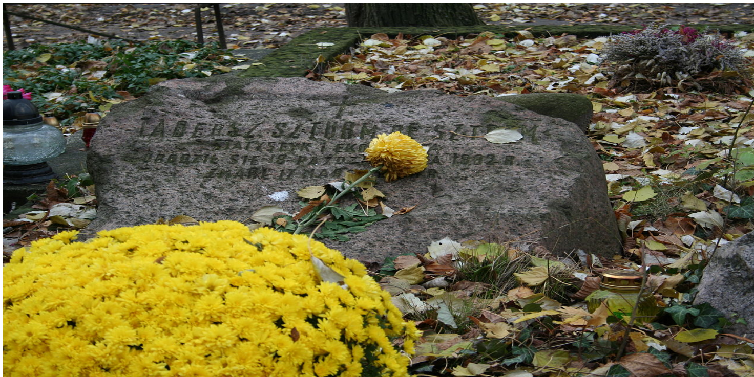
Grób Tadeusza Szturm de Sztrema na warszawskim Cmentarzu Powązkowskim, 2012 r.

https://przystanekhistoria.pl/pa2/tematy/legiony/81377,Czlowiek-z-cienia-Tadeusz-Szturm-de-Sztrem-w-walce-o-niepodlegla-Polske-1914-192.html