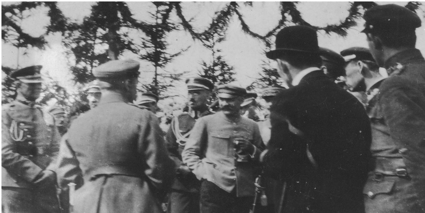
Józef Piłsudski i gen. Kazimierz Sosnkowski (na lewo od naczelnika) wśród gości zebranych na Lotnisku Mokotowskim (obecnie Pole Mokotowskie) podczas poświęcenia i próby pierwszego polskiego samolotu, 23 sierpnia 1919 r.

https://przystanekhistoria.pl/pa2/tematy/lotnictwo/93386,Poczatki-produkcji-samolotow-w-niepodleglej-Polsce-1918-1921.html