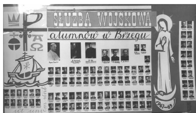
Tableau służby wojskowej alumnów w jednostce wojskowej w Brzegu w latach 1967-1969

Szacuje się, że do wojska powołano blisko 3000 alumnów, choć jest to liczba niepewna. Najwięcej wcielono ich w drugiej połowie lat sześćdziesiątych, co było spowodowane silnym napięciem stosunków państwa i Kościoła w związku z konfrontacją milenijną, czyli kościelnymi obchodami Milenium Chrztu Polski i państwowymi Tysiąclecia Państwa Polskiego. Rekordowy był rok 1968, gdy do wojska powołano prawie 300 kleryków z całego kraju. Wyraźny spadek liczby wcielanych, a także powolne osłabianie tej antykościelnej represji, następowały od połowy lat siedemdziesiątych. W 1973 roku zlikwidowano jednostkę w Szczecinie, w 1979 w Brzegu. W 1979 wcielono też ostatnich kleryków, by w kwietniu 1980 roku zwolnić ich wszystkich. Było to skutkiem wieloletnich zabiegów Episkopatu Polski i samego prymasa Wyszyńskiego.