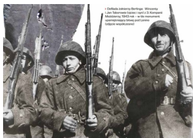
» Działka żołnierzy Berlinga. W tle widoczny Jan Matejko (zobacz rozdz. 2). Nagrobek powstał w 1943 roku – w ten moment rozpoczęli się prace nad stworzeniem orzełka 1. Dywizji.

W rzeczywistości był to orzeł wymyślony przez twórcę dziewiętnastowiecznego nagrobka z płockiej katedry, ale nie przeszkodziło to w kreacji pseudopiastowskiego mitu orzełka 1. Dywizji. Sami żołnierze z lekceważeniem nazywali go kurcią lub kaczką – choć i tak był lepszy od czerwonej gwiazdy.