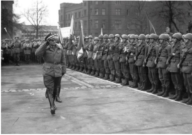
Gen. Florian Siwicki przed frontem żołnierzy wracających z CSRS, Wrocław, 4 listopada 1968 r.

Od 24 do 26 sierpnia w Moskwie trwały rozmowy między delegacją czechosłowacką, na czele której stali Svoboda i Dubczek, a sowiecką, której przewodniczyli Breżniew i premier Aleksiej Kosygin. Delegacja czechosłowacka podpisała tzw. protokół moskiewski 26 sierpnia. W zamian za przyrzeczenie pacyfikacji w kraju, uzyskano zapewnienie, że wojska interwencyjne zostaną wycofane po zlikwidowaniu zagrożenia socjalizmu w Czechosłowacji. Od tego momentu napięcie zaczęło opadać. Jednostki interwencyjne zaczęły wycofywać się z miast i skoncentrowały się na terenach leśnych i obszarach podmiejskich. Podczas wizyty delegacji czechosłowackiej w Moskwie 3 października dokonano przeglądu realizacji protokołu moskiewskiego. 16 października w Pradze podpisano układ o warunkach czasowego stacjonowania Armii Sowieckiej na terytorium Czechosłowacji.