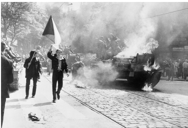
Płonący sowiecki czołg w Pradze, 1968 r.

Wynik spotkania był dla kierownictwa czechosłowackiego tak szokujący, że nie został ujawniony opinii publicznej. Od Drezna rozpoczęła się akcja wywierania nacisku na Pragę, aby zaprowadziła „w tym kraju porządek oraz zdławiła kontrrewolucję”.