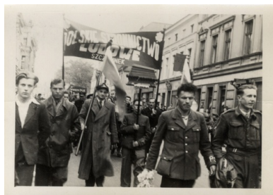
Manifestacja podczas obchodów Święta 3 Maja w Szczecinku w 1946 r.

W manifestacjach odbywających się w różnych częściach kraju można było zauważyć znaczący udział młodzieży szkolnej i studenckiej, ta grupa była też najaktywniejsza. Okrzyki wznoszone przez manifestujących z reguły wyrażały one sympatię dla PSL i jej lidera – Stanisława Mikołajczyka, znalazły się w nich też akcenty antyrządowe i antysowieckie.