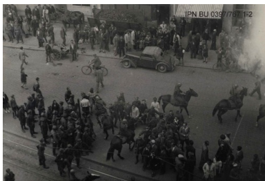
Milicja na koniach rozpędza studentów na Świętym Marcinie w Poznaniu, 13 maja 1946 r.