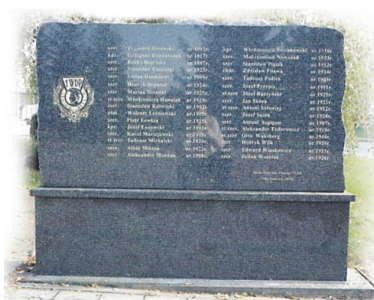
Tablica z nazwiskami 32 żołnierzy 1. Dywizji Piechoty, którzy zginęli w Podgajach