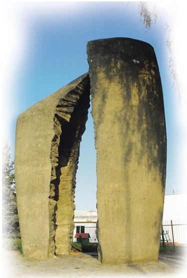
Pomnik upamiętniający żołnierzy polskich zamordowanych w Podgajach w 1945 roku

Pod koniec wojny większość łotewskiej dywizji (ok. 8500 żołnierzy) dostała się w Schwerinie do niewoli aliantów zachodnich. Amerykanie przyznali im później prawo do azylu.