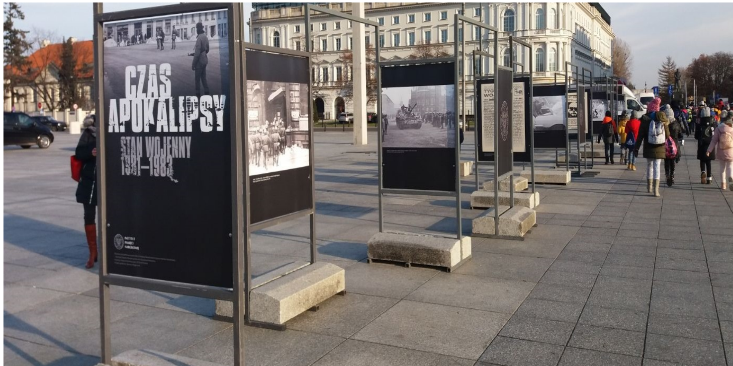
Wystawa IPN „Czas apokalipsy. Stan wojenny 1981-1983” - Warszawa, 12-19 grudnia 2019

https://przystanekhistoria.pl/pa2/tematy/mlodziez/60855,Najmlodszy-internowany-stanu-wojennego-jest-dzisiaj-historykiem-IPN.html