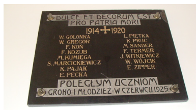
Tablica w Zespole Szkół im. gen. Władysława Sikorskiego w Rudniku nad Sanem, dawnym Państwowym Seminarium Nauczycielskim Męskim.