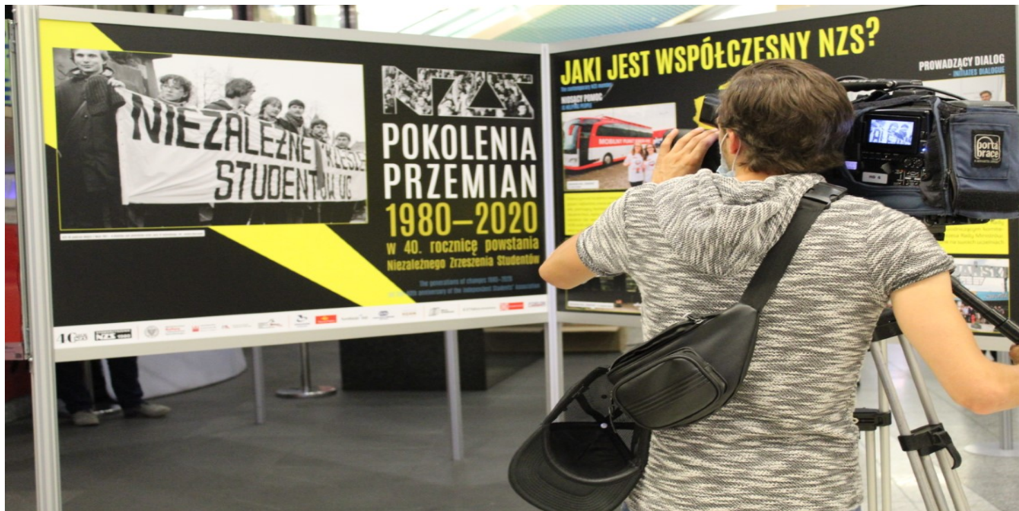
Odślonięcie wystawy „NZS - pokolenia przemian 1980-2020” na Dworcu Głównym w Krakowie.

https://przystanekhistoria.pl/pa2/tematy/mlodziez/87967,Bialostockie-Niezalezne-Zrzeszenie-Studentow-w-latach-1982-1983.html