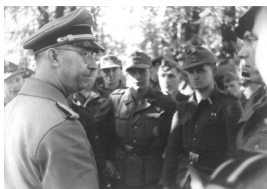
Heinrich Himmler podczas inspekcji na froncie zachodnim - październik 1944 r.

Od sierpnia 1943 r. Himmler poszerzył jeszcze zakres swojej władzy, gdyż został wówczas ministrem spraw wewnętrznych Rzeszy, zaś od lipca 1944 r. głównodowodzącym armii rezerwowej. W ostatniej fazie wojny, gdy klęska reżimu była już tylko kwestią czasu, od połowy 1944 r. snuł plany budowy IV Rzeszy z nowym rządem, któremu sam by przewodził. Próbował też nawiązać negocjacje w sprawie zawarcia odrębnego pokoju z aliantami zachodnimi. Kiedy Hitler dowiedział się o jego działaniach, pozbawił go pod koniec kwietnia 1945 r. najwyższych urzędów, w tym nawet członkostwa w NSDAP.