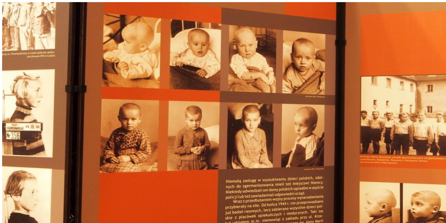
Plansza wystawy IPN pt. „Germanizacja dzieci polskich w czasie II wojny światowej”

https://przystanekhistoria.pl/pa2/tematy/obozy-koncentracyjne/61296,Dzieci-z-Przemyslowej-niemiecki-oboz-w-Lodzi.html