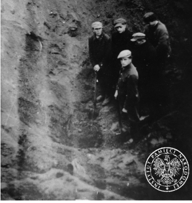
Członkowie komisji ekshumacyjnej w północno- wschodniej części obozu, 7 listopada 1945 r.