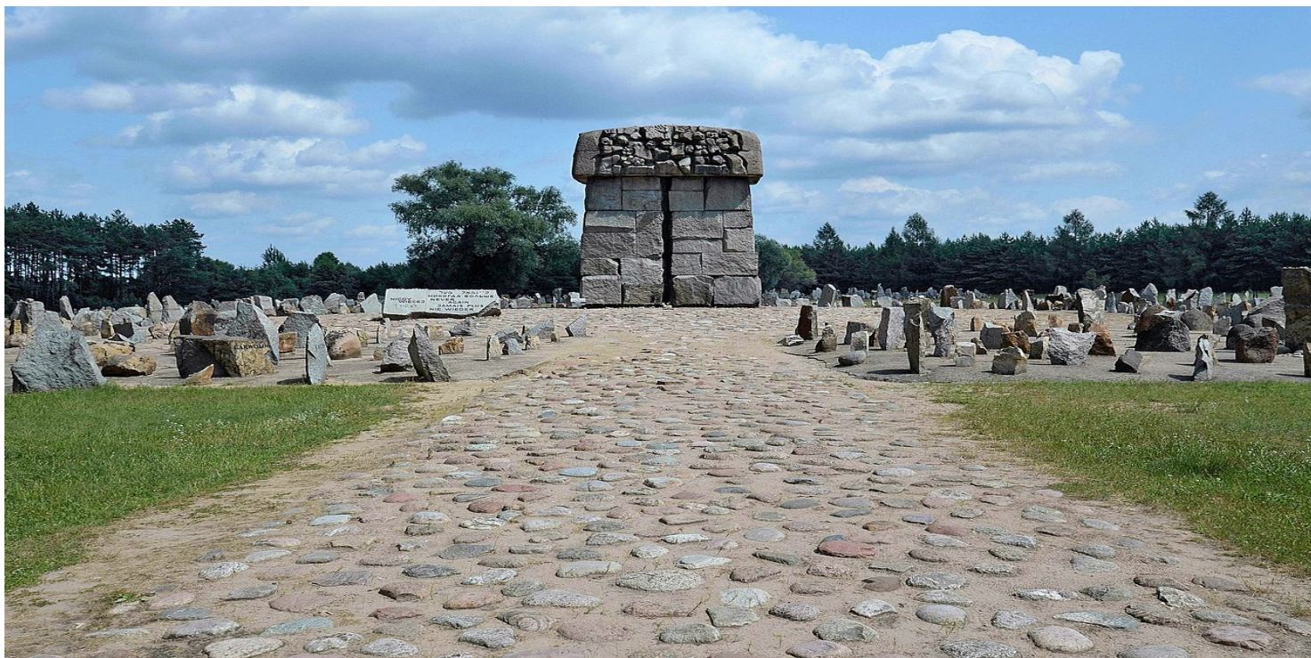
Pomnik na terenie obozu zagłady Treblinka II.

https://przystanekhistoria.pl/pa2/tematy/obozy-koncentracyjne/61710,Oboz-zaglady-w-Treblince.html