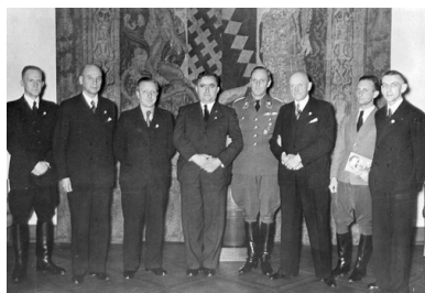
Grupa volksdeuschów po