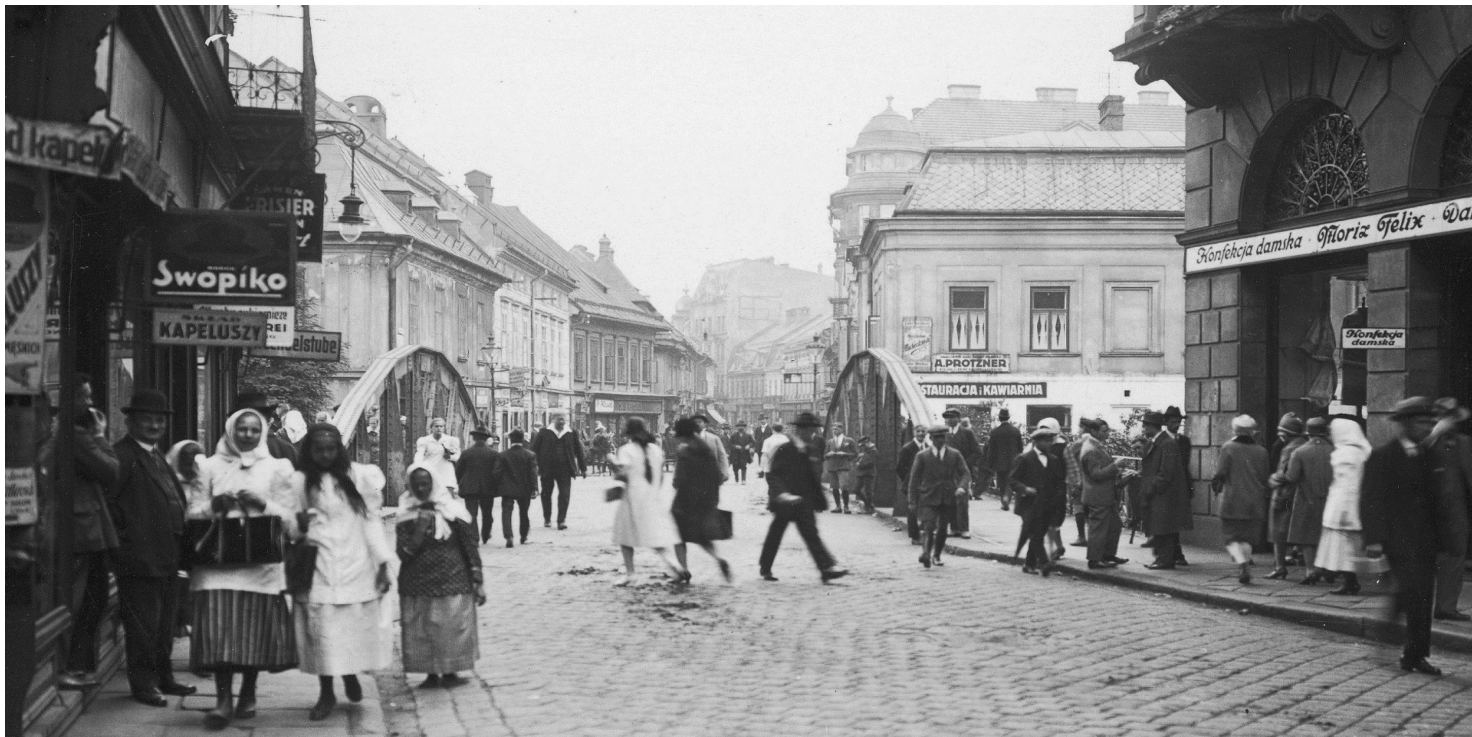
Bielska ulica w okresie międzywojennym.

https://przystanekhistoria.pl/pa2/tematy/obozy-koncentracyjne/96282,Niezłomny-Szkic-do-portretu-Edward-Jan-Zajaczek-19011942.html