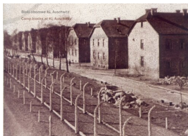
Bloki obozowe KL Auschwitz. Fot.

Pierwsza próba zrozumienia sytuacji przez Pileckiego: „Ach! Więc zamknęli nas w zakładzie dla obłąkanych!” przeradza się szybko w rzeczywistą ocenę stanu rzeczy. Każdego pytano po niemiecku, kim był w cywilu. „Odpowiedź: ksiądz, sędzia, adwokat powodowała bicie i śmierć. Przedemną w piątce stał jakiś kolega, który na to pytanie, rzucone mu z równoczesnym ujęciem go garścią za ubranie pod gardłem, odpowiedział: »Richter« [niem.: sędzia]. Fatalny pomysł! Po chwili był na ziemi bity i kopany”. Pilecki wreszcie zrozumiał: „Więc wykańczano specjalnie inteligencję. Po tym spostrzeżeniu zmieniłem nieco zdanie. To nie obłąkańcy, to jakieś potworne narzędzie do wymordowania Polaków, rozpoczynające swe dzieło od inteligencji”.