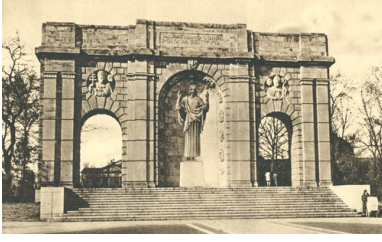
Pomnik Najświętszego Serca Pana Jezusa w Poznaniu. Pocztówka wydana w Krakowie w 1937 r.