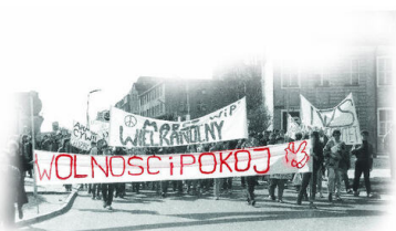
„Marsz wielkanocny”, pierwsza legalna manifestacja opozycyjna