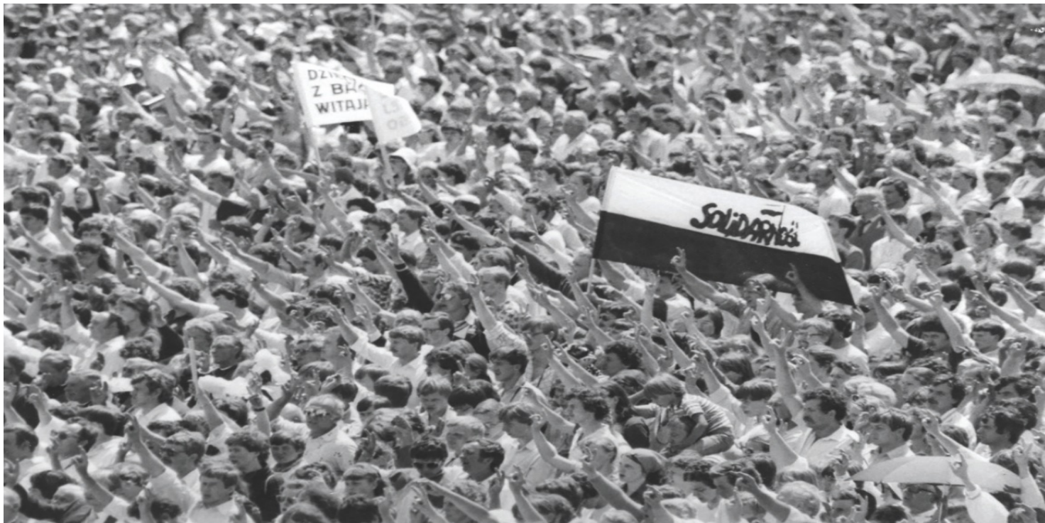
Druza pielgrzymka Jana Pawła II do Polski; Msza św. beatyfikacyjna m. Urszuli Ledóchowskiej, Poznań, 1983 r.

https://przystanekhistoria.pl/pa2/tematy/opozycja-w-prl/85630,Solidarnosc-relacja-miedzyosobowa.html