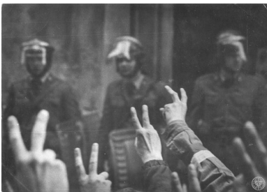
3 maja 1983 r., Warszawa, demonstracja NSZZ „Solidarność”.

Zjawisko historyczne, którym była w latach osiemdziesiątych polska Solidarność, miało strukturę trójwarstwową. Na poziomie najbardziej powierzchniowym, na pierwszym planie wydarzeń, był to związek zawodowy. Instytucja ta jednak z różnych powodów nie zrzeszała wszystkich Polaków utożsamiających się z jej misją, toteż podzielałam ogólnie przyjętą opinię, że Solidarność była – w swej głębszej istocie – ruchem społecznym, obejmującym nie tylko członków związku i ich rodziny, lecz także licznych sympatyków, nienależących do tej organizacji. Moim zdaniem istniał jeszcze trzeci poziom tego zjawiska – najtrudniej uchwytny, a zarazem podstawowy. W swojej najgłębszej warstwie Solidarność była międzyosobową relacją łączącą większość ówczesnego polskiego społeczeństwa, przejawiającą się w ludzkich postawach, decyzjach, działaniach i dziełach.