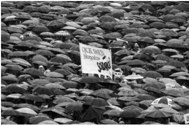
Wierni pod parasolami na mszy papieskiej na lotnisku Muchowiec w Katowicach. Druga pielgrzymka Jana Pawła II do Polski, 1983.