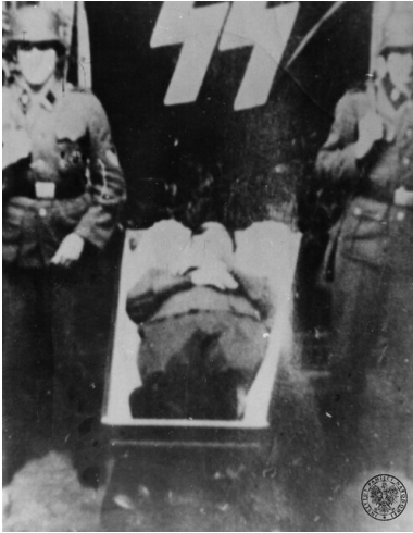
Trumna ze zwłokami kata Warszawy, dowódcy SS i Policji na Dystrykt Warszawa SS- Brigadeführera Franza Kutschery, podczas jego pogrzebu w Warszawie. Zdjęcie niemieckie.

I wreszcie następował akt ostatni, który miał złamać morale Polaków: nazwiska zamordowanych odczytywano przez szczekaczki, dodając na końcu imienną listę kolejnych zakładników. W krajobrazie miasta na stałe pojawiły się obwieszczenia z danymi zabitych i wybranych do egzekucji, drukowane na charakterystycznym ciemnoróżowym papierze.