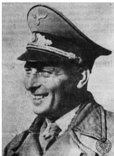
Ludobójca. Franz Kutschera.