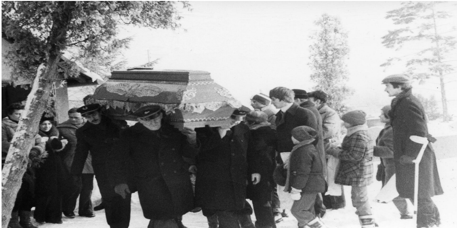
Uroczystości pogrzebowe górnika zastrzelonego podczas pacyfikacji KWK "Wujek", Katowice, 21 XII 1981 r.

https://przystanekhistoria.pl/pa2/tematy/polskie-wigilie/104848,Zamordowano-mu-kolegow-na-terenie-kopalni.html