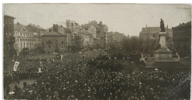
Pochód narodowy na Krakowskim Przedmieściu w Warszawie, 5 listopada 1905 r.

Pamiętano o tych, którzy przed laty poszli w bój – jak pod Węgrówem, gdzie powstańcy styczniowi stoczyli bitwę uwiecznioną przez Cypriana Kamila Norwida: „U Polaka tyle Węgrów wart,/ Tyle!... co Termopile....”. U progu niepodległej, w 1917 r., mieszkańcy miasteczka i okolicznych wsi zdobyli się na niezwykle czyn, utrwalony na kilku fotografiach. Widać na nich kilkudziesięciu ludzi – może przystanęli, by złapać oddech. Są odświętnie ubrani. Zbierali się po niedzielnej Mszy św. i niczym budownicowie piramid, tygodniami ciągnęli i pchali przez pięć kilometrów na drewnianych okrągłakach ogromny narzutowy głaz. Stoi on do dzisiaj na miejscu spoczynku poległych w lutym 1863 r. Tak właśnie, bez niczyjego nakazu, z woli miejscowych mieszkańców powstał pomnik, znaczący miejsce rozpaczliwej szarży kosynierów, kolejnych polskich Termopil w naszych dziejach. A przecież trwała jeszcze I wojna światowa, ileż było nieszczęścia, biedy, chorób, codziennych trosk, a oni zamówili najlepszego warszawskiego kamieniarza. Co pchnęło ich do tego trudu? Być może odpowiedzią jest napis umieszczony na pomniku: „Na prochach waszych z pól polskich kamienia/ wznoszą przez pamięć wdzięczne pokolenia/ 1917”.