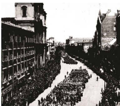
Uroczystości 3 maja na Krakowskim Przedmieściu w Warszawie, 1916 r. Fot.