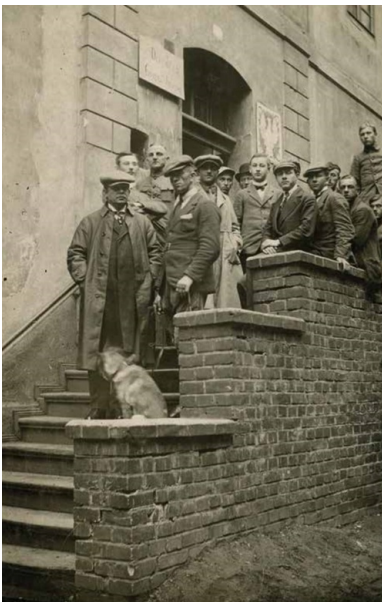
Wojciech Korfanty przed siedzibą dowództwa Grupy „Północ” wojsk powstańczy timer w Tworogu w