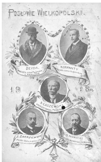
Grupa wielkopolskich posłów do parlamentu w Berlinie, 1918 r.

W 1904 r. wszedł także do pruskiego parlamentu krajowego. Startował z okręgu wyborczego Środa-Śrem-Września w Wielkopolsce, co było świadectwem zaufania, jakie pokładał w nim polski ruch polityczny zaboru pruskiego. Na forach obu parlamentów Korfanty z „talentem oratorskim” i „odwagą cywilną” (jak wspominał po latach Wojciech Trąmpczyński) atakował germanizacyjną politykę władz niemieckich w prowincjach wschodnich Rzeszy.