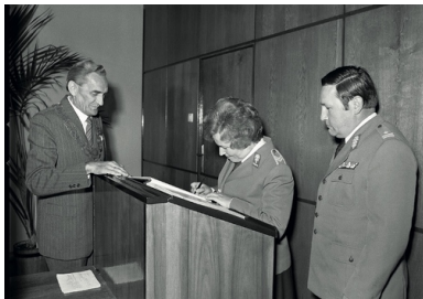
Uroczystość nadania imion w Urzędzie Stanu Cywilnego, 1983 r.